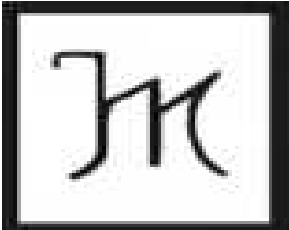
Ganadería Hermanos Mayoral