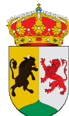
Ayuntamiento de Toro

Promovido por la Asociación Cultural “Foro Taurino de Zamora” ante la necesidad de dar proyección a nuevos valores para el mundo taurino, y atendiendo al buen número de jóvenes que desean tener una oportunidad pública, por medio de la celebración del “Primer Bolsín Taurino Tierras de Zamora” los distintos ayuntamientos y entidades organizadoras y colaboradoras, se suman al fomento y la promoción de la Fiesta de los Toros tratando a la vez de dar a conocer y promocionar las distintas localidades y comarcas de Zamora contribuyendo al mismo tiempo, al celebrarse todos los festejos a puertas abiertas y con entrada gratuita, al fomento de la afición al mundo de los toros, tan arraigada en toda la provincia.