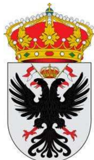
Ayuntamiento de Fuentesaúco